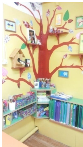
Центр «Активного счета»