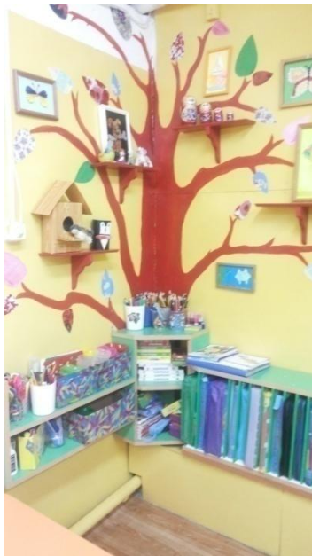
Центр «Активного счета»